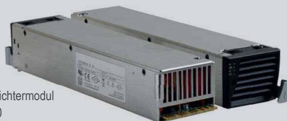
Oben: Gleichrichtermodul GR 850 Links: Rückseite / Rechts: Front