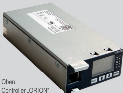
Oben: Controller „ORION“