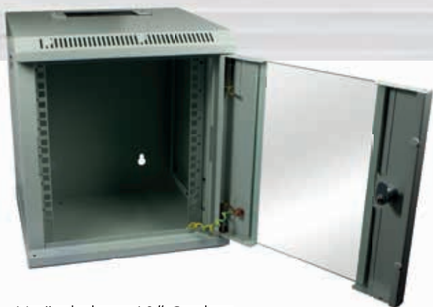
Veränderbare 10" Streben Türen umbaubar