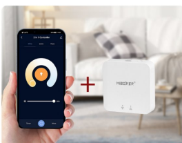
Support Tuya smart app control (Zigbee 3.0 gateway is needed)