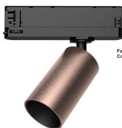
Farbe: Messing gebürstet Color: brushed brass