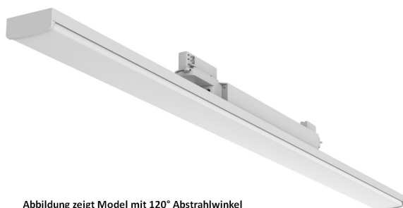
Abbildung zeigt Model mit 120° Abstrahlwinkel