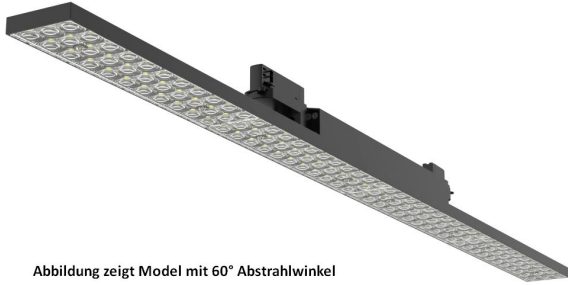
Abbildung zeigt Model mit 60° Abstrahlwinkel