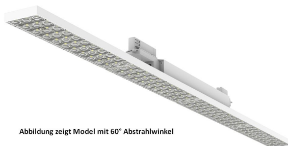
Abbildung zeigt Model mit 60° Abstrahlwinkel