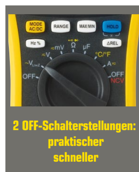
2 OFF-Schalterstellungen: praktischer schneller