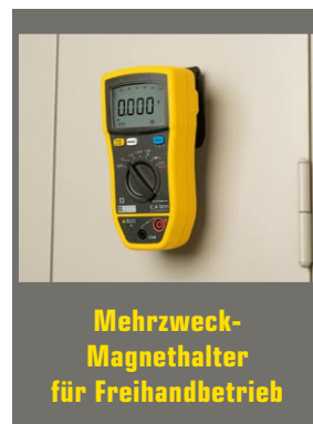
Mehrzweck- Magnethalter für Freihandbetrieb