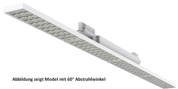
Abbildung zeigt Model mit 60° Abstrahlwinkel