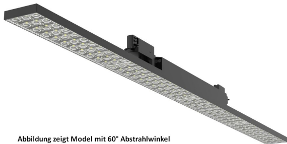
Abbildung zeigt Model mit 60° Abstrahlwinkel