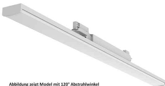
Abbildung zeigt Model mit 120° Abstrahlwinkel